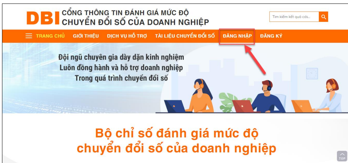
Nút đăng nhập tài khoản

Bước 1: Tại màn hình trang chủ của hệ thống, người dùng nhấn chuột vào nút “ Đăng nhập ” trên thanh công cụ