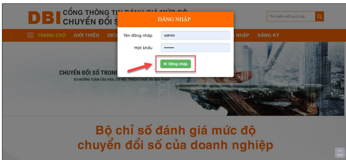
Màn hình đăng nhập

Bước 2: Điền “ Tên đăng nhập ” và “ Mật khẩu ” của quản trị hệ thống → Nhấn chuột vào nút “ Đăng nhập ”